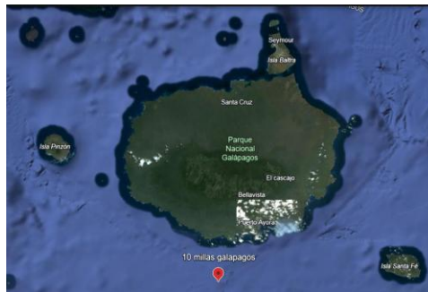
Figura 1 Mapa de estación de muestreo

Se realizaron registros, oceanográfico de acuerdo con el siguiente detalle: